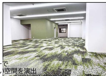
アースカラーで居心地の良い空間を演出